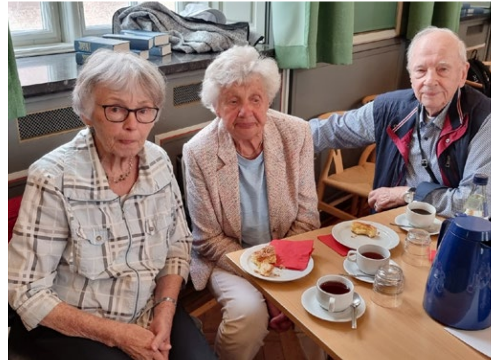
og som en glædelig overraskelse kunne vi også hilse på tre 75 års jubilarer