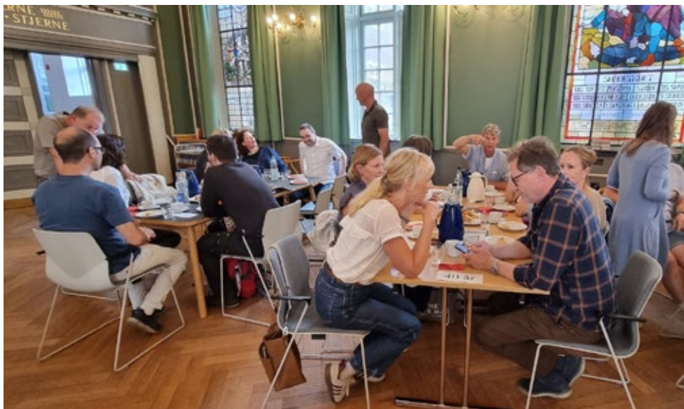
Der kom et pænt antal 25-, 30- og 40-års jubilarer

Vi kunne glæde os over et stort fremmøde af jubilarer ved sammenkomsten i forbindelse med dimissionen i år.