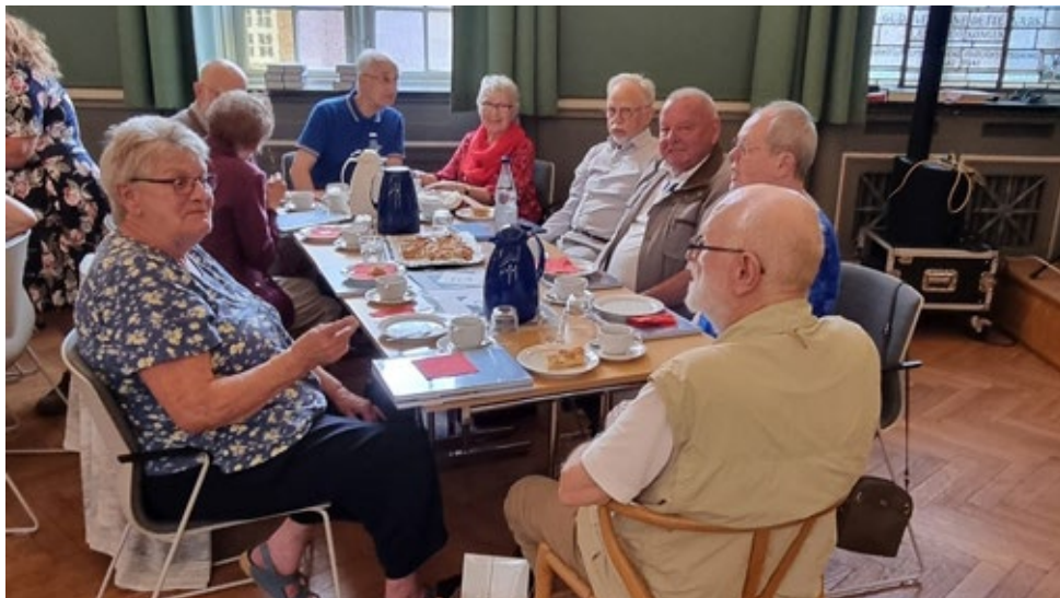
65 års jubilarerne fyldte et helt bord,