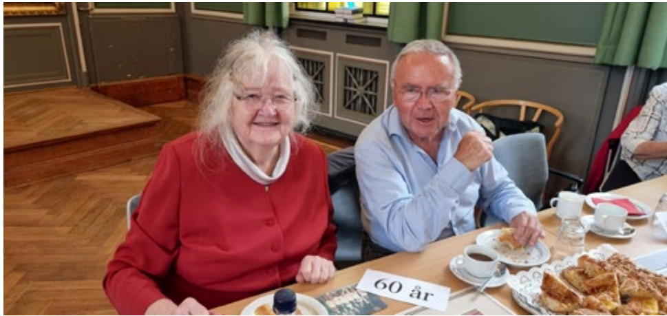
Af de 3 fremmødte 60-år jubilarer kom desværre kun to med på billedet