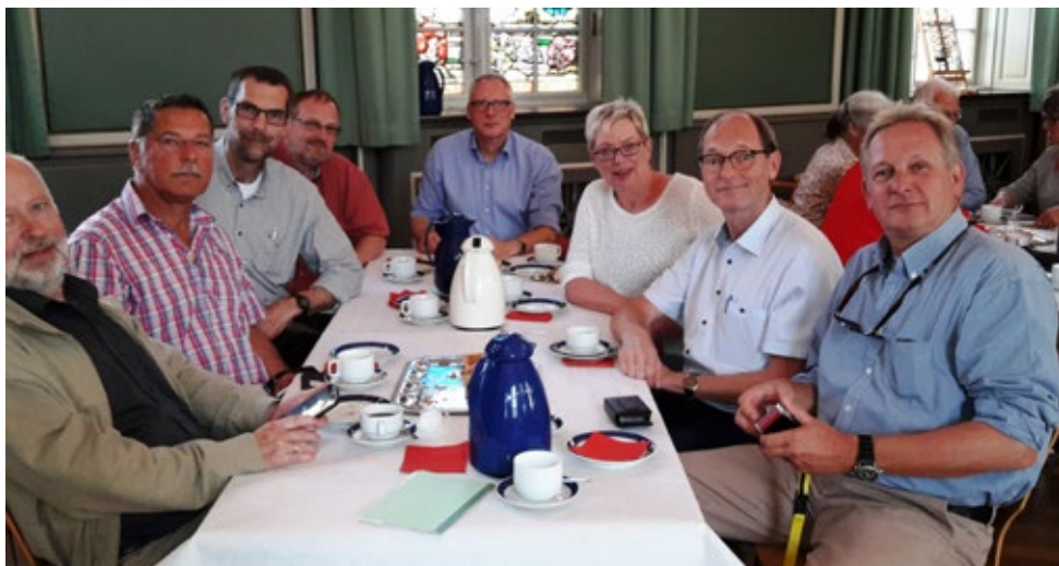
og særlig mange 50-års-jubilarer.